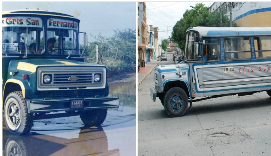
Imagen 3. Dos buses de la empresa Gris San Fernando: A la derecha con colores de TSS y a la izquierda con colores tradicionales de la empresa