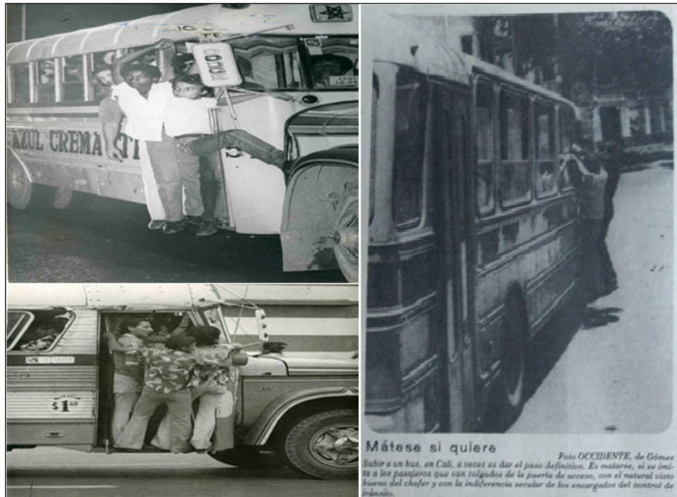
Imagen 1. Buses con sobrecupo por las calles de Cali - años 70