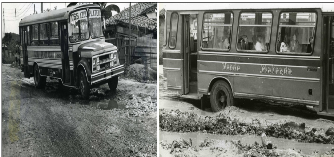
Imagen 2. Buses transitando por el oriente de Cali. Años ochenta