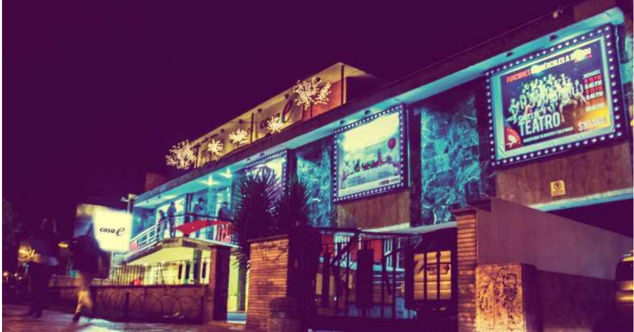
Casa E (barrio La Soledad).

Teusaquillo, denominada por artistas, organizaciones y por el Consejo Local de Cultura como la “Localidad Cultural de Bogotá”, ofrece a la ciudad y al país una significativa oferta cultural, soportada en gran medida por la variedad de organizaciones de diverso orden, así como por su patrimonio histórico, arquitectónico, ambiental y urbanístico.