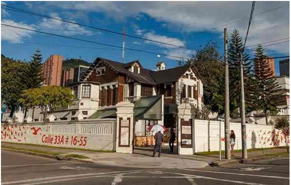
Casa Oriéntame

Oriéntame es una fundación integrada por un equipo multidisciplinario de profesionales de la salud y de apoyo altamente calificados, sensibles a las necesidades de las mujeres y parejas; que brindan servicios médicos y de orientación para la atención y prevención en salud sexual y reproductiva con los más altos estándares de calidad. Es una organización creada en 1977 con naturaleza privada y de beneficio social, controversial desde sus inicios por ser una entidad que ofrece la interrupción voluntaria del embarazo de forma legal. Sin embargo, por encima de su controversia, es una fundación que definitivamente vela por cumplir los derechos de la mujer, uno de los tantos temas sociales con los que deseamos trabajar, entendiendo que la cultura es el eje central de las transformaciones en pro del