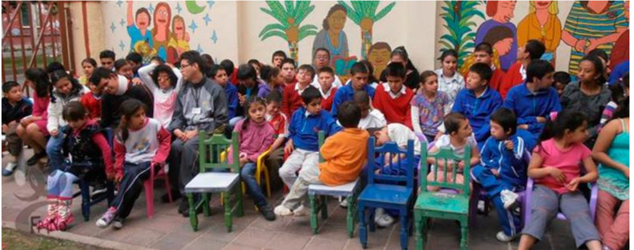
Fundación FRINE

Es una entidad con sede en Teusaquillo, sin ánimo de lucro de beneficio común que brinda servicio de protección integral a población vulnerable y/o en condición de discapacidad múltiple, para mejorar su calidad de vida y la de sus familias, mediante la prestación de programas sociales, orientados a la garantía de sus derechos promoviendo su inclusión a la sociedad. Parte de sus programas están enfocados también a la educación artística, como método de enseñanza, ejercicio social de inclusión y desarrollo de habilidades de los niños pertenecientes a esta fundación. Como parte de nuestra creencia del poder transformador de la música y el arte en la sociedad, es de nuestro interés realizar acercamientos y eventos con fundaciones que nos permitan trabajar en pro del mejoramiento del entorno de nuestra localidad.