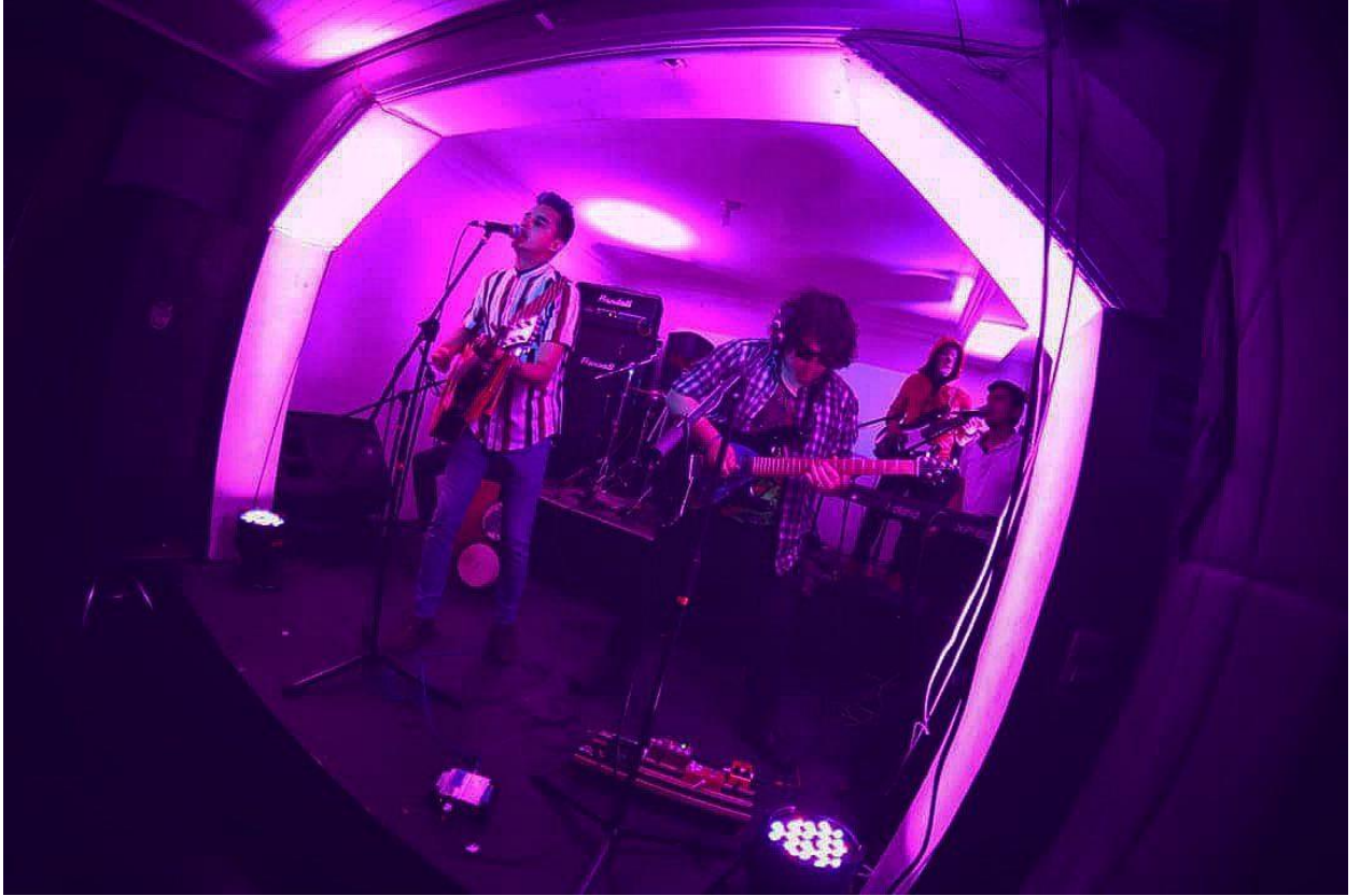
Escenario BBR

Beer, Bikes & Rock Pub es el EMV (Escenario de Música en Vivo) más metalero de Teusaquillo, a través de los años ha sufrido varias transformaciones, pasando de ser Index Finger a Inferno y actualmente, BBR. Sin embargo, es un lugar que no pierde su esencia y clientes metaleros, quienes pueden disfrutar de las noches, acompañados de sonidos extremos en vivo. Entendiendo que es de los pocos lugares en Teusaquillo en donde se pueden ver bandas de metal en vivo, queremos también incluir este venue como parte de nuestro circuito musical.