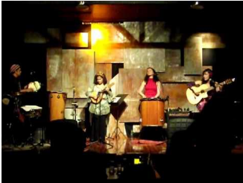
Escenario Trementina Artes

En el corazón del ParkWay, Trementina es uno de los café/bar más representativos y antiguos del barrio La Soledad. En dónde la combinación entre arte y “pasar un buen rato” adquiere toda la representación de Teusaquillo en un solo lugar. Un bar en el que además de apreciar buen arte se lee y se pasa una tarde deliciosa con jazz de fondo y en este lugar también se organizan tertulias para hablar de temas de actualidad. Al lado de Trementina Bar, se inauguró hace unos años Trementina Artes, un lugar en el que se le daría mayor relevancia a diferentes prácticas artísticas, cuenta con una tarima en dónde se presentan espectáculos de música, danza, teatro y hasta cuenteros; se realizan lanzamientos de libros,