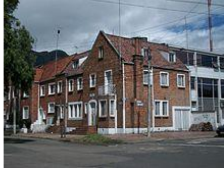
Casa de Teusaquillo.