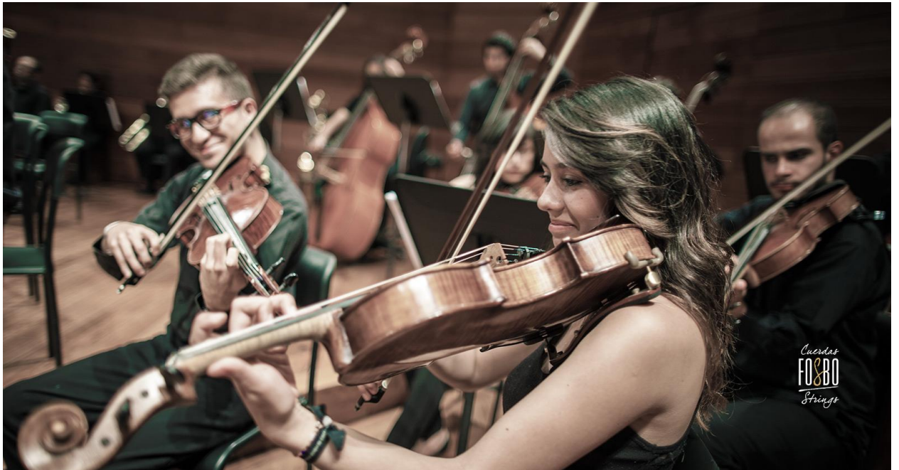
Concierto FOSBO

Es una organización 100% privada dedicada a la difusión de todas las formas de expresión que involucran la interpretación musical de instrumentos sinfónicos. En su búsqueda por generar empleos para los músicos sinfónicos egresados, la FOSBO se ha convertido en una de las fundaciones de arte sinfónica con mayor reconocimiento a nivel nacional, permitiendo no sólo la consolidación de su orquesta, como una opción diferente a las del Estado, si no viviendo la gestión cultural como uno de sus mayores ejes. Dentro de sus proyectos de gestión cultural podremos generar alianzas y abrir espacios de convergencia en el que podamos seguir trabajando en pro de la cultura en Bogotá.