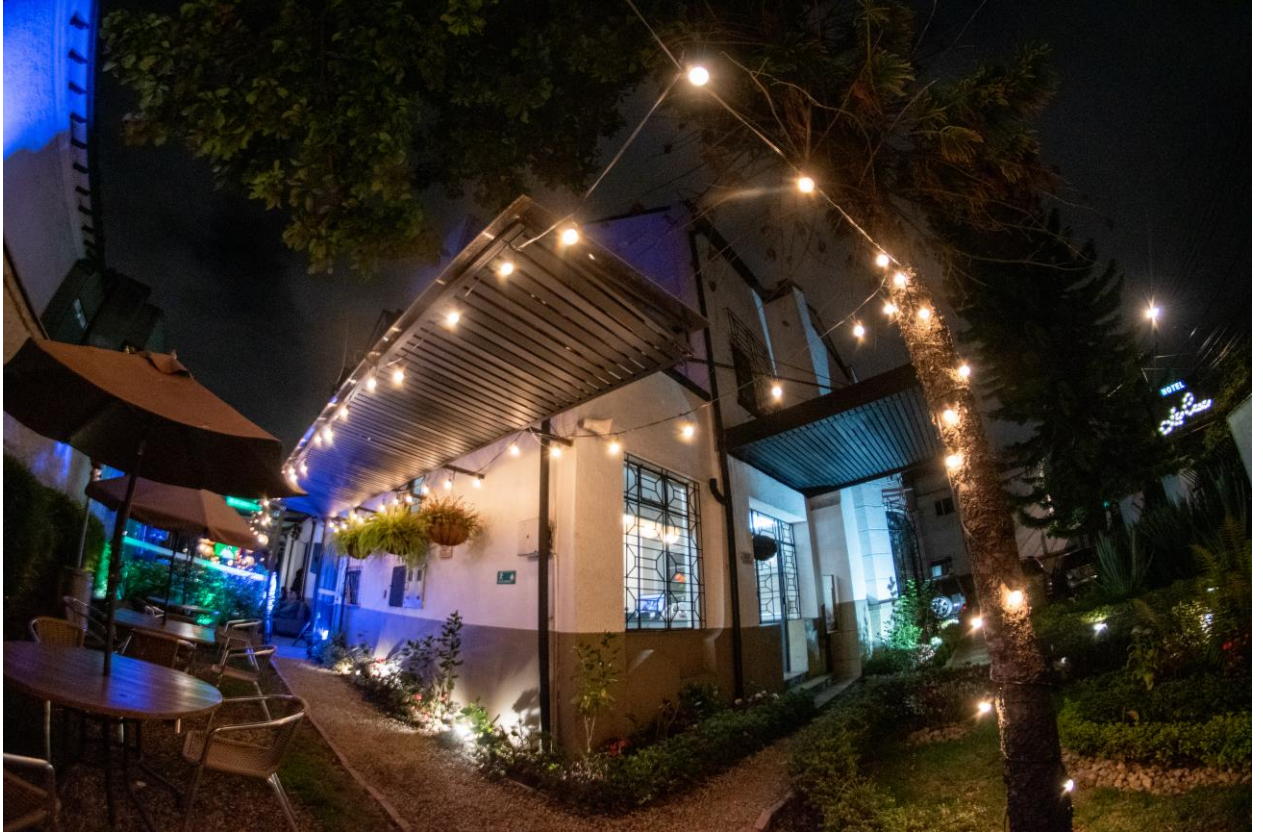
Cinco Razones

Cinco Razones es un lugar en el corazón Teusaquillo, que evoca toda la belleza de la arquitectura de esta localidad, fundado inicialmente como un restaurante, es ahora el lugar perfecto para que los residentes puedan disfrutar de un buen evento en la noche o un brunch acompañados de música. Hemos encontrado en Cinco Razones un lugar perfecto como sede de nuestros circuitos musicales, con los cuales ya hemos tenido un acercamiento y un evento del que hablaremos más adelante.