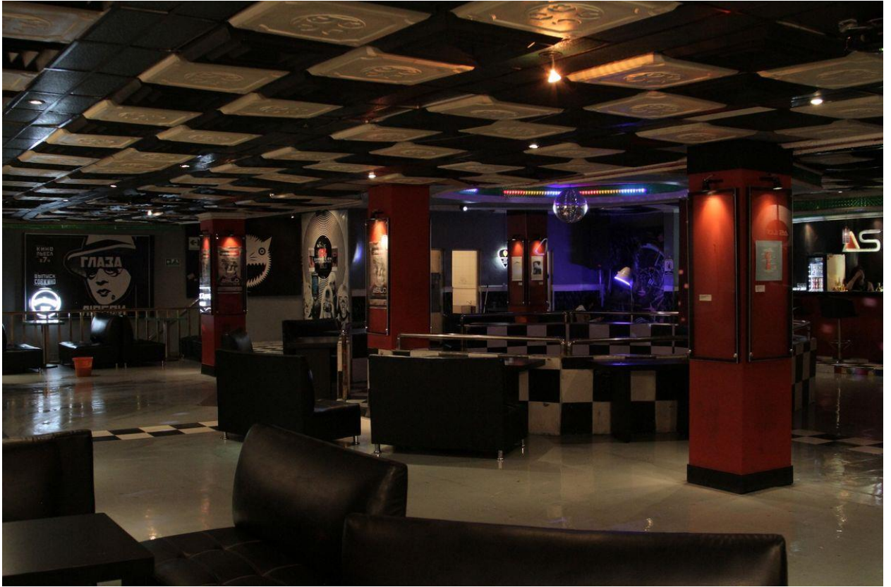
Asilo Bar

Desde el 2011, Asilo se ha convertido en un ícono para toda la escena alternativa, punk y rockera de Bogotá. Denominado como “el refugio de los melómanos”, Asilo acoge a todos los jóvenes amantes de la música independiente y alternativa. Creemos que su público objetivo es el reflejo de las características de gran parte de la población joven del sector, lo que nos hace ponerlos en nuestra mira y definitivamente incluir a Asilo como parte de nuestro circuito musical.