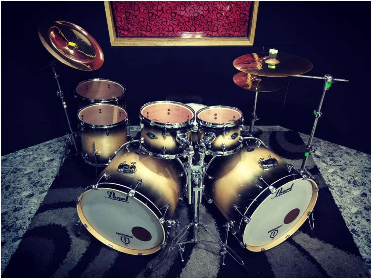
Estudio de Grabación Independent