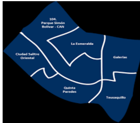
Mapa de la Localidad Teusaquillo (UPZ).

conformada por seis UPZ (Unidades de Planeación Zonal): Galerías, Teusaquillo, Parque Simón Bolívar, La Esmeralda, Quinta Paredes y Ciudad Salitre Oriental. (Secretaría de Cultura, Recreación y Deportes, 2019) 25