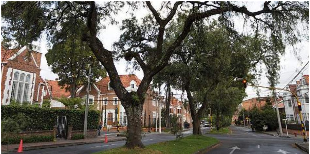
Foto de Teusaquillo.

La localidad también hace parte del sistema de ciclorrutas, con los corredores ubicados en las avenidas Eldorado, La Esperanza, NQS, calle 63, carrera 68, calle 53, el entorno del parque Simón Bolívar y la biblioteca Virgilo Barco. (Instituto Distrital de Recreación y Deportes, 2019) 26