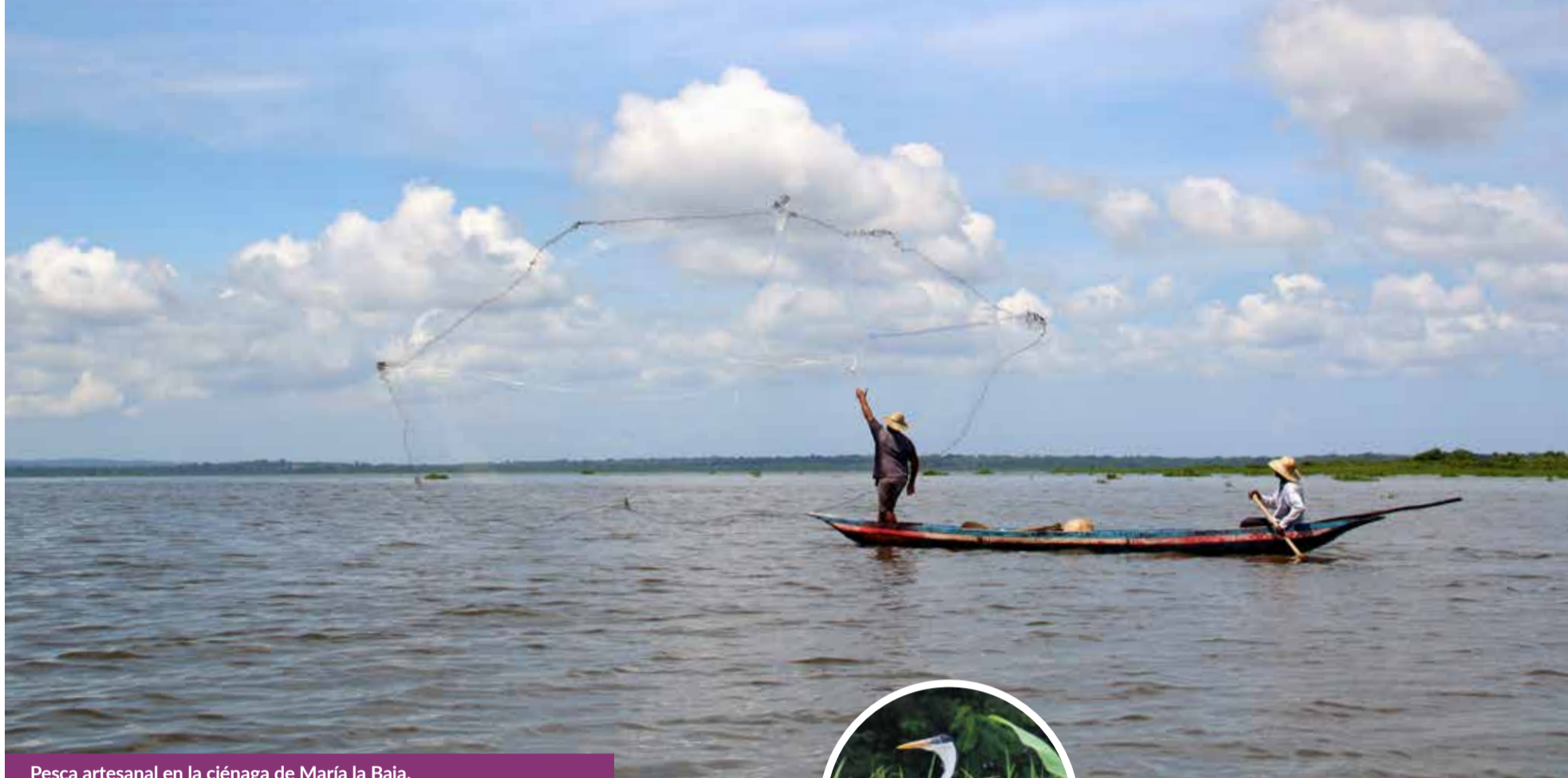
Pesca artesanal en la ciénaga de María la Baja.

A rroyos, ríos, manantiales, caños, quebradas, brazos, lagunas, embalses, ciénagas, esteros, humedales, jagüeyes; son en pocas palabras: cuerpos de agua. En Colombia, los paisajes territoriales parecieran haber ocultado ese otro conjunto de atractivos acuíferos, pero a pesar de ello, han venido cobrando un altísimo interés, por lo menos desde el decreto oficial, mundial, de cambio climático, presentado en la VI Conferencia Internacional Sobre Cambio Climático de la ONU en el año 2000.