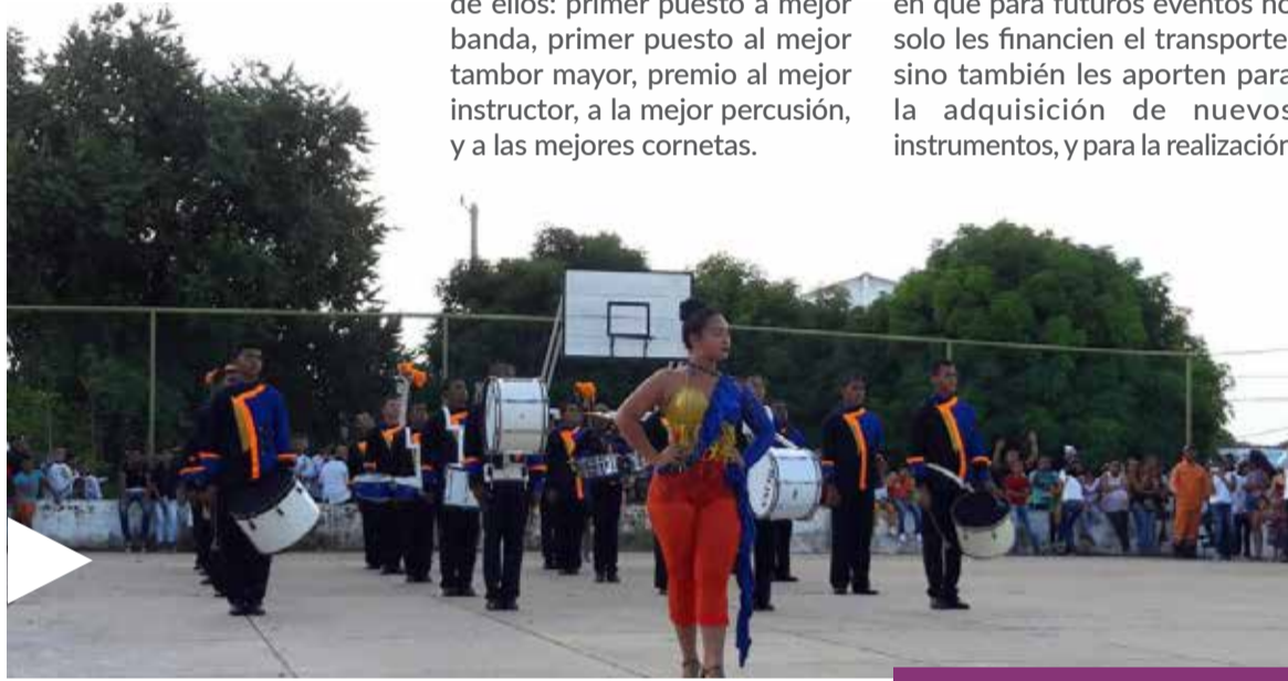
Estos jóvenes integrantes de la banda, representan a María la Baja en importantes festivales y concursos a nivel regional y nacional.

Tras su cosecha de premios, a los que se suman otros logrados en años anteriores en diferentes concursos, confían en que para futuros eventos no solo les financien el transporte, sino también les aporten para la adquisición de nuevos instrumentos, y para la realización