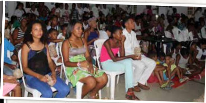
Participantes del proyecto Laboratorios Vivos e invitados, disfrutaron la proyección de los documentales en la inauguración de la muestra audiovisual en la Casa de la Cultura de María la Baja.