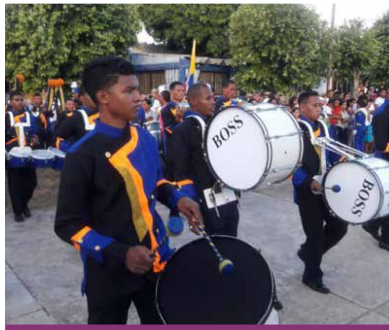
La Banda Rítmica Imperial Puesta del Sol está conformada por 40 jóvenes del municipio de María la Baja; músicos y bailarines.

de capacitaciones, que generen estímulos a su consolidación y profesionalización.