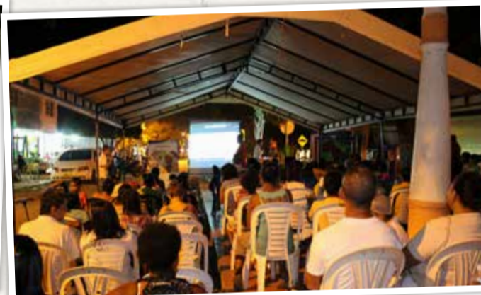
Con lleno total se realizó la primera jornada de muestras audiovisuales "Métete en la película" en los municipios participantes.