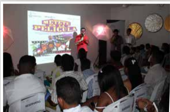
Participantes y familiares disfrutaron de una noche de magia y creatividad en la inauguración de la primera noche de muestras audiovisuales "Métete en la película" en Clemencia.