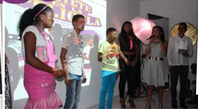
Los aprendices de la primera cohorte en Clemencia contando su enriquecedora experiencia de creación audiovisual.