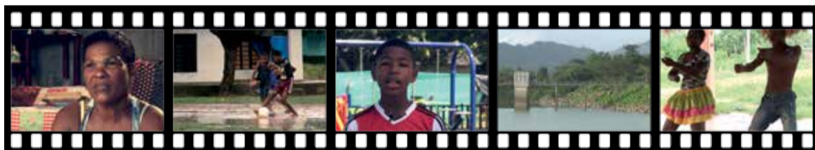
Los dulces de Amelia Fútbol marialabajense Culturyplus: Centros recreativos El embalse de Playón Cambios del baile