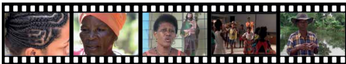
Los peinados africanos Diario de Pabla Mi barrio, mi gente Máximo, Recordar es vivir Pescadores de Puerto Santander