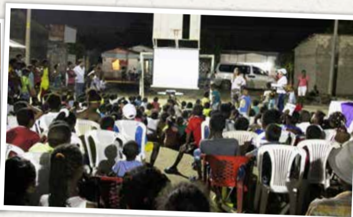
Con gran participación infantil se llevó a cabo el segundo día de la muestra audiovisual en la cancha del barrio Chumbún en María la Baja.