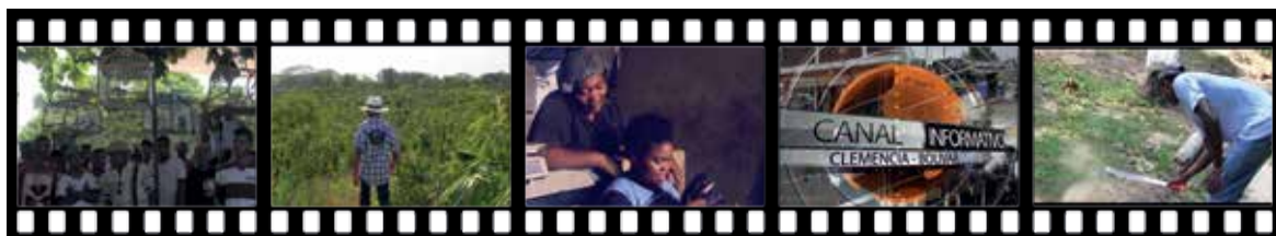
Canarios cantores Jóvenes al Cultivo Dulces Quinceañeros Noticiero NVC Clemencia Cosecha