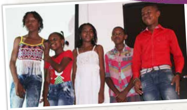
Los aprendices de la primera cohorte en María la Baja brillaron con luz propia en la premier de sus productos audiovisuales.

Muestra Audiovisual de los Laboratorios Vivos de Innovación y Cultura realizada en María la Baja del 15 al 17 de septiembre y en Clemencia del 22 al 24 de septiembre