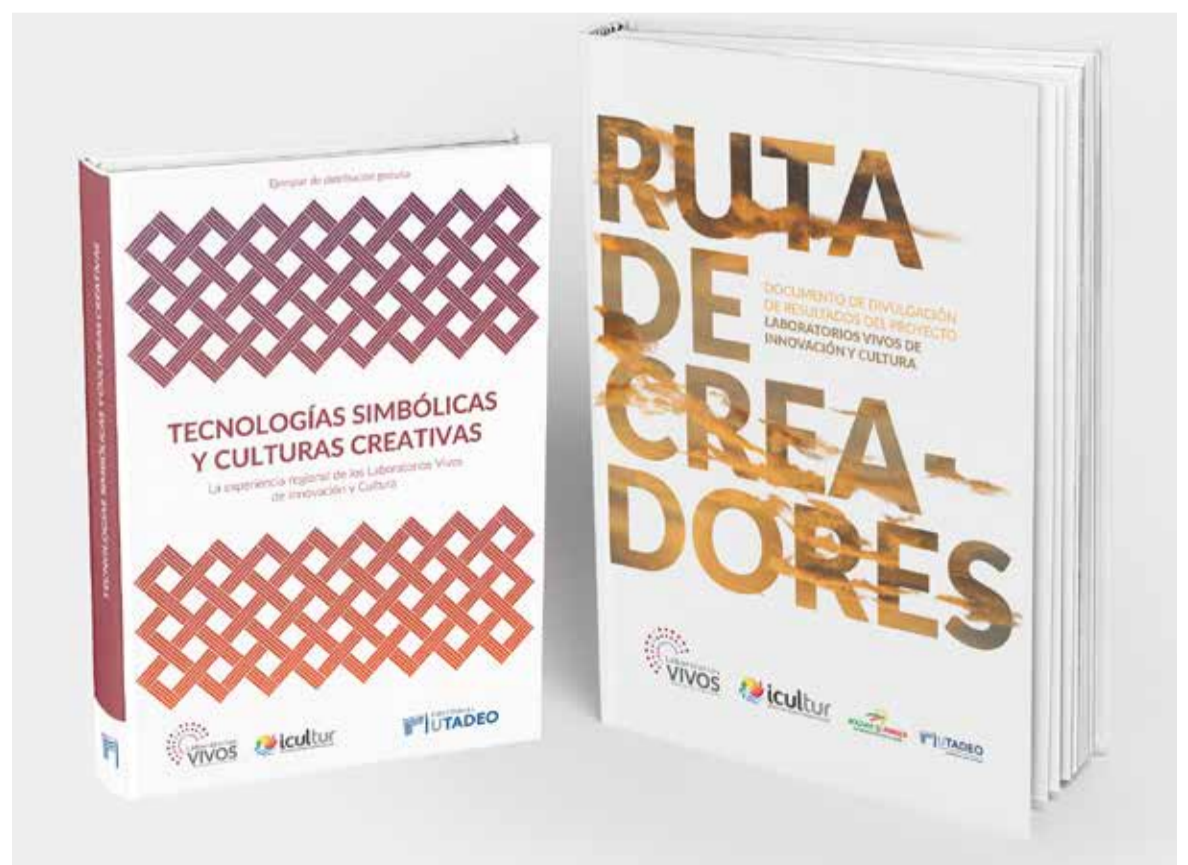
Portadas de los libros “Tecnologías simbólicas y culturas creativas” y “Ruta de creadores”.