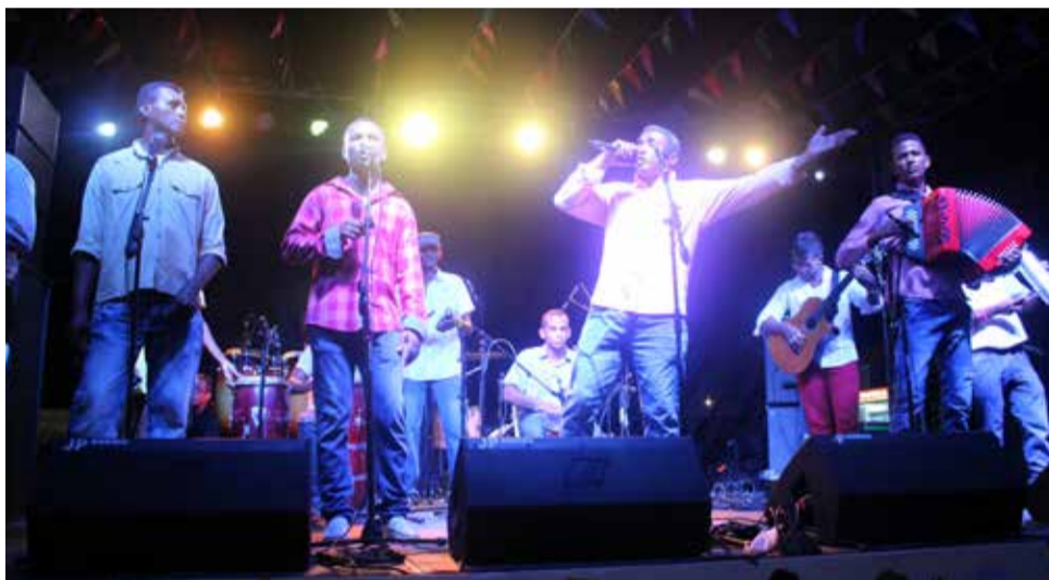
Con gran entusiasmo y alegría se llevó a cabo en Clemencia y María la Baja el festival Vive Bolívar. La agrupación vallenata San José de Clemencia fue la encargada en este municipio de dar inicio a los shows en tarima con su gran repertorio musical.