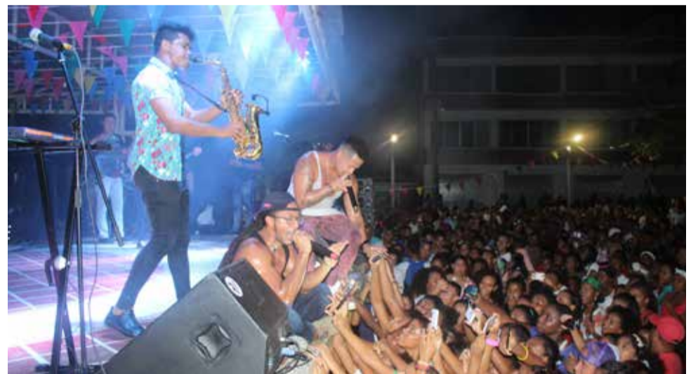
La agrupación de champeta Bazurto All Stars fue la encargada de cerrar la fiesta en ambos municipios, donde los asistentes cantaron y bailaron cada uno de sus éxitos.