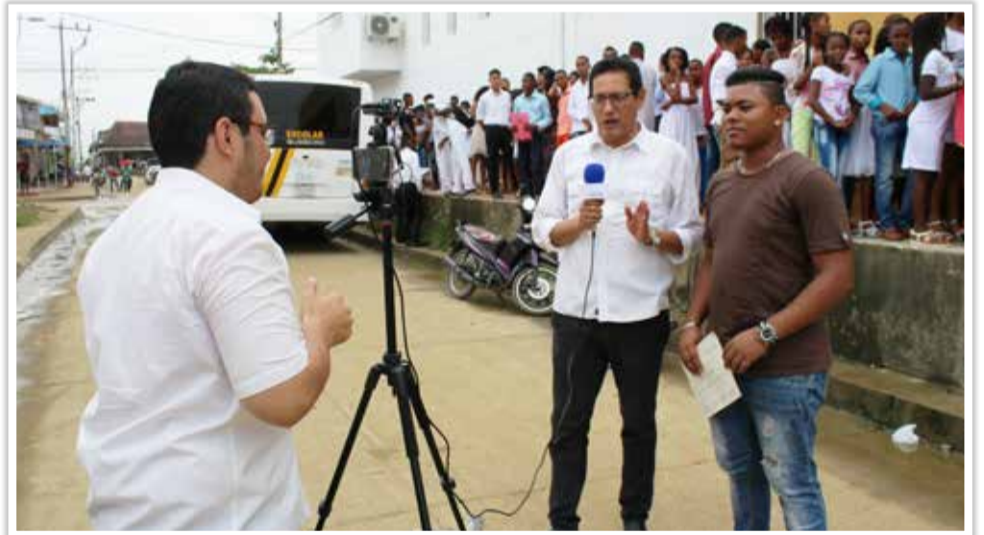
Con un cubrimiento periodístico en el que intervinieron varios participantes del grupo de formación y miembros del equipo de comunicación y cultura se llevó a cabo el festival "Vive Bolívar".