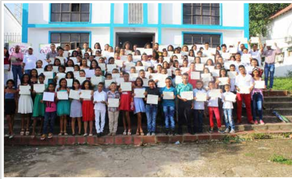
Grupo de Aprendices de los Laboratorios Vivos reunidos en la parroquia San José de Clemencia luego de la ceremonia de graduación en el municipio.