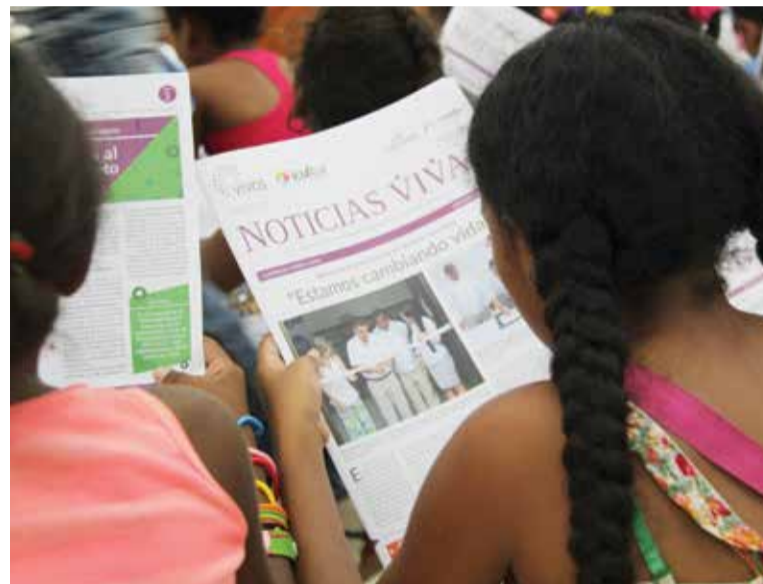
Participante de los Laboratorios Vivos leyendo la tercera edición del periódico cultural Noticias Vivas.

A los libros se suman artículos académicos escritos por integrantes de las áreas de investigación, inclusión productiva y comunicación y cultura, susceptibles de ser insertados en revistas indexadas de universidades colombianas o del exterior.