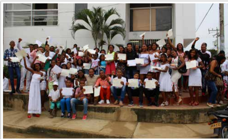
Los Aprendices del programa de formación del Proyecto Laboratorios Vivos de Innovación y Cultura en María la Baja, disfrutaron de su ceremonia de graduación en compañía de familiares y amigos.