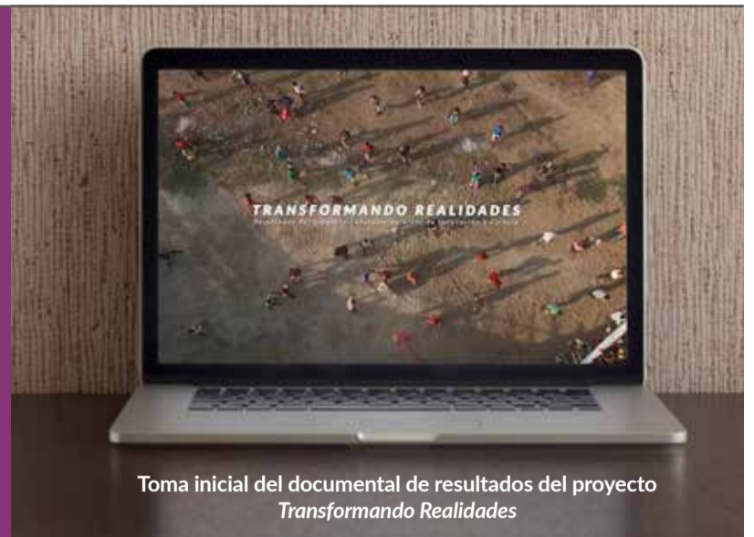
Toma inicial del documental de resultados del proyecto Transformando Realidades

Con la culminación del programa de formación de los Laboratorios Vivos de Innovación y Cultura se refuerza la entrega de resultados del proceso formativo, investigativo y de impacto social logrados por el proyecto en los municipios de Clemencia y María la Baja. Las publicaciones surgidas durante su ejecución servirán en gran medida como memoria documental, pero también como hoja de ruta para las posibles réplicas de esta iniciativa que se realicen en el país.