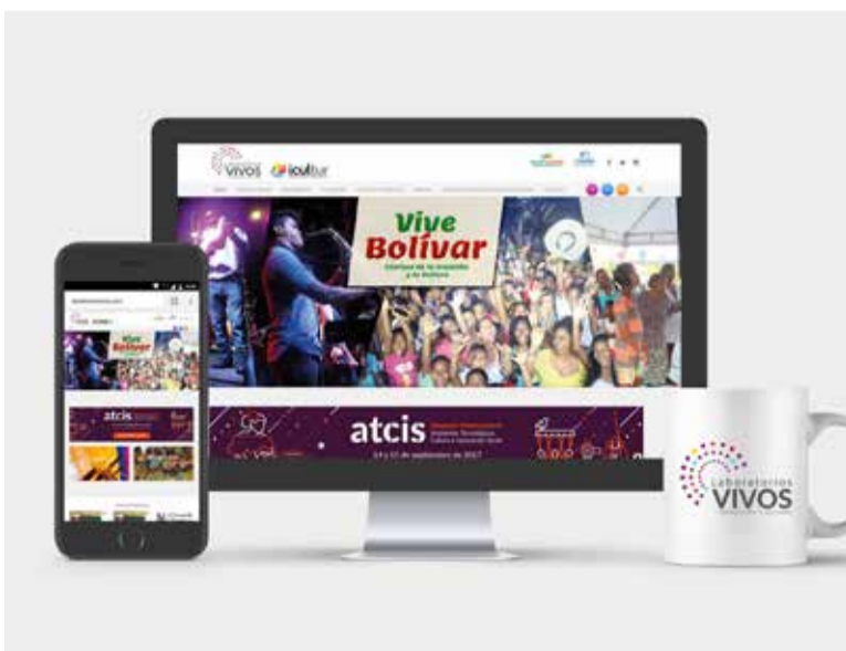
Portal web del proyecto www.laboratoriosvivos.com

Las diferentes publicaciones están en sintonía con el nivel de esta experiencia piloto, reconociendo la importancia y trascendencia de sus logros e impactos y otorgando a la cultura de Clemencia y de María la Baja la dimensión que merece.