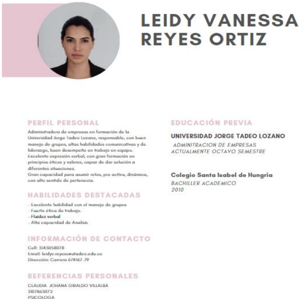
Ilustración 2 : .Hoja de vida

Por medio de una compañera de la estudiante le sugirió que en la empresa que laboraba estaban solicitando el cargo de practicante en el área de administración y la estudiante decidió enviar su hoja de vida y postularse para el cargo de practicante, la cual tuvo que pasar por algunos filtros y fue aceptada por la empresa con la cual en menos de una semana ya estaría empezando su contrato laboral como practicante en RM de Colombia.