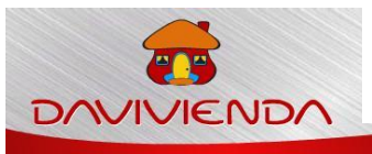
Ilustración 5. Clientes de RM de Colombia:

Rm de Colombia de Colombia cuenta con clientes muy reconocidos en el mercado, los cuales le brindan prestigio y distinción a la empresa, los cuales son: