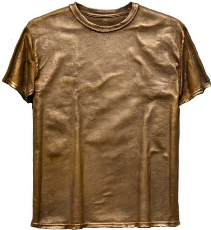
Figura 4 Tee Shirt