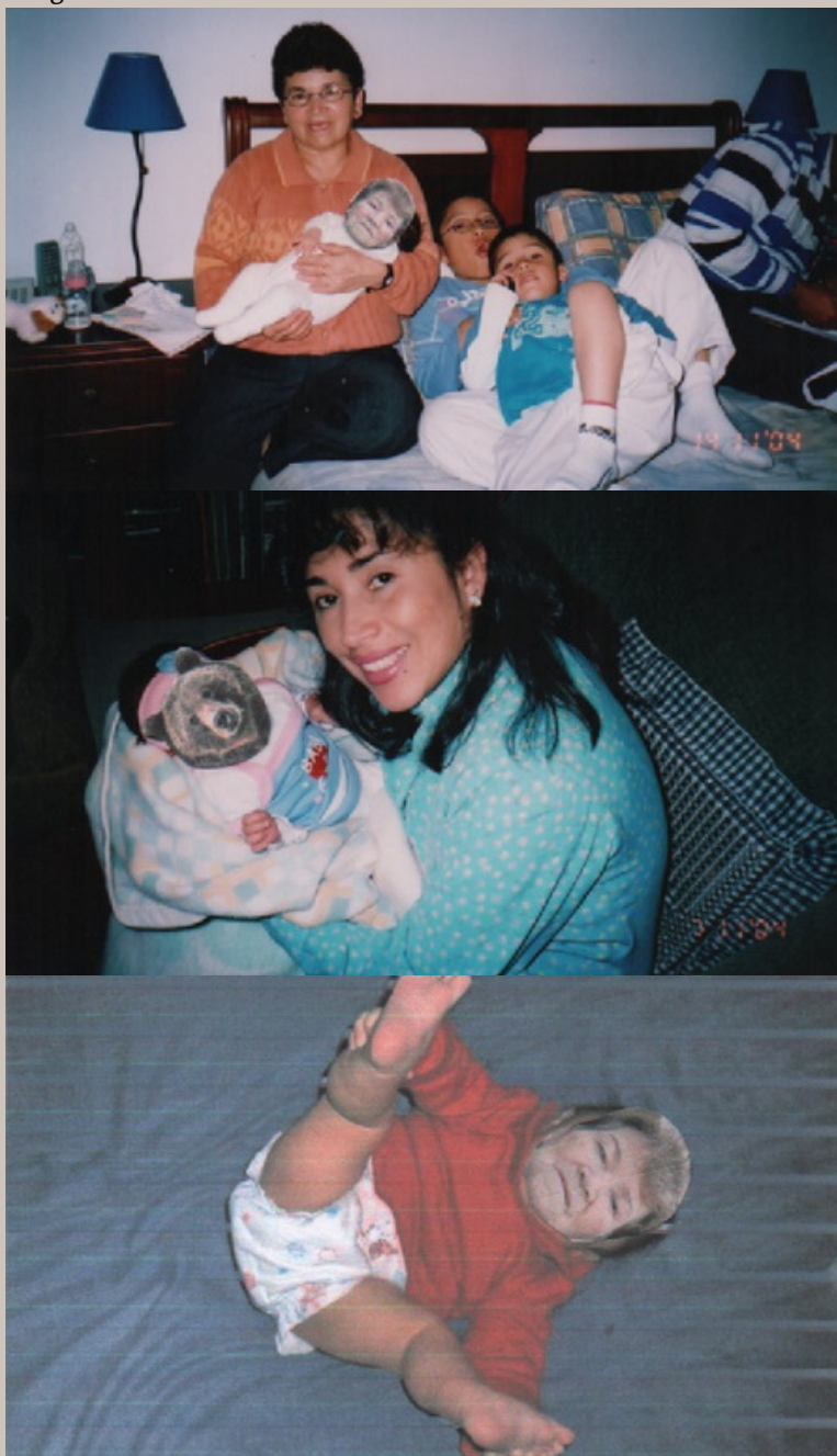
Figura 3 Imágenes siniestras