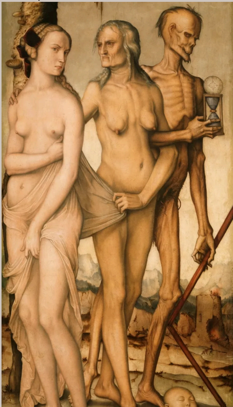
Figura 2 Las Edades y la Muerte

Nota. fuente tomada de Museo del Prado, (1541- 1544)