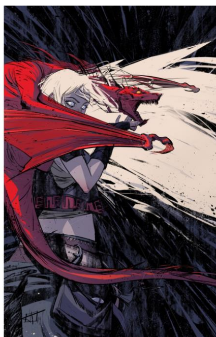
IMAGEN 3. DRACARYS. Fanautor: Tony Infante. https://toniinfante.com/projects En: https://toniinfante.com/fan-art-illustrations

Puesta argumental. Dracarys es la palabra en el idioma Alto Valyrio 31 , con la que Daenerys ordena “fuegodragón”, es la voz de despliegue del ataque de fuego, aunque Daenerys se comunica mentalmente con sus hijos dragón, esta orden siempre es verbalizada como un susurro de muerte inminente.