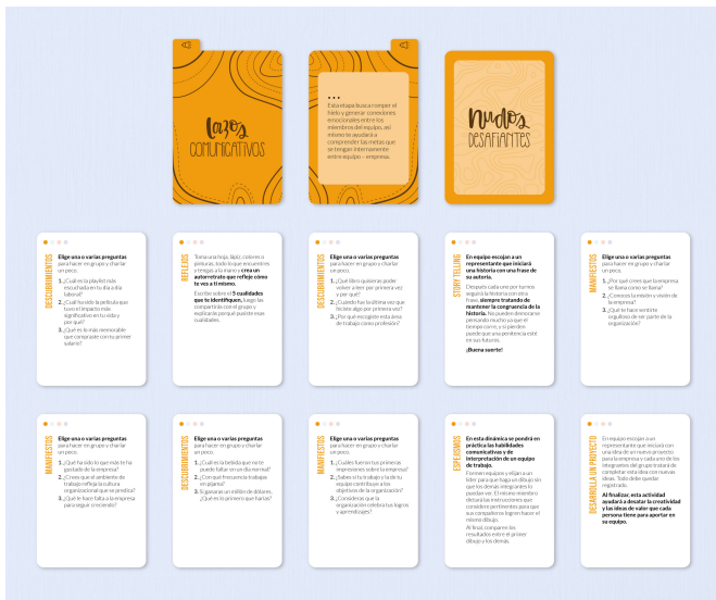
Figura 2. Cartas de la etapa Lazos Comunicativos.

hilos u ondas rodeando la carta, lo quise agregar al relacionarlo con el nombre del mazo “nudos desafiantes” y para darle más profundidad al diseño con una textura que llamara la atención y fuera distintiva.