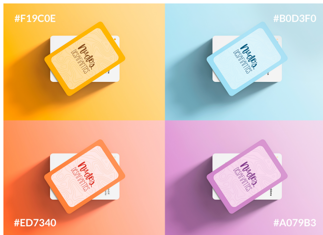
Figura 6. Dorsos cartas Nudos Desafiantes. Fuente: Gabriela Borja Salgado.

de 8,2 pt utilizando las variantes de bold e italic para facilitar la lectura y resaltar puntos importantes, con un interlineado de 10 pt y alineado a la izquierda y para títulos utilicé Acumin Variable Concept ExtraCondensed Semibold en un puntaje de 15 pt todo a una sola línea ya que estos textos están ubicados de forma vertical al lado izquierdo del cuerpo de texto principal.