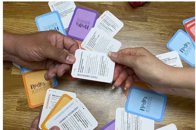
Figura 8. Nudos Desafiantes en contexto.

Como este mazo está pensado para ser un producto producido de forma física, los materiales elegidos fueron dos, para la caja se utilizará una cartulina apta para impresión digital de 220 gr y para las cartas se utilizará una cartulina de 200 gr ambas de color blanco para resaltar los colores al momento de la impresión, además tendrán un acabado mate y un barnizado UV para las texturas, las cartas se verán más llamativas, interesantes y cómodas al tacto para el usuario.