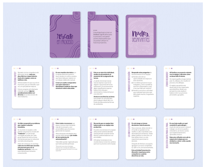
Figura 5. Cartas de la etapa Rescate en Proceso.

Tanto el logotipo del mazo como el de cada etapa fueron creados desde cero por mi autoría, iniciando con un proceso de bocetación a mano alzada. A partir de la creación de un moodboard donde recopilé diferentes tipos de lenguaje, ilustración, lettering, colores y estilos, probé diferentes diseños y diagramaciones que fueran por la misma línea gráfica, escogí uno que funcionara de la mejor manera el cual digitalicé y vectoricé para mejor visualización y fácil procesamiento para impresión, este proceso fue un poco largo ya que inicialmente convertiría estos glifos en una tipografía pero al momento de realizar este proceso se me facilitó crearlos desde vectores directamente en Illustrator, tomando como referencia claramente los bocetos hechos en papel y lápiz. En cuanto a las tipografías utilizadas para los cuerpos de textos de cada carta utilicé la familia Montserrat en un puntaje