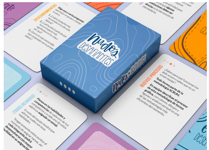
Figura 1. Vista general de Nudos Desafiantes.

Como producto final de mi proyecto Nudos Desafiantes realicé un card sorting completo y funcional compuesto por 40 cartas (10 por categoría). Cada carta tiene unas dimensiones de 5,7 cm x 8 cm; decidí usar este tamaño a partir de referencias de otros juegos de cartas que son fáciles de trasladar y manejar, desde ahí modifiqué un poco el tamaño para optimizar la diagramación, así junto con unas puntas redondeadas el manejo de las cartas sería más cómodo y además, se agregaron 4 cartas extras de 5,7 cm x 8,6 cm que funcionan como cartas de instrucciones de las cuatro categorías que componen el mazo de cartas; cada una de estas tiene en ese espacio extra, una “pestaña” con un icono referente a su categoría que funcionan como separadores entre etapas. Así mismo cada categoría tiene un color diferente el cual refleja muchas características que quise transmitir a través de cada etapa y así mismo ayudan a diferenciarlas más fácilmente. La primera etapa: lazos comunicativos tiene asignado el color naranja el cual evoca sensaciones de entusiasmo y vitalidad, la segunda etapa: estrategias desencadenantes tiene asignado el color azul el cual se asocia muchas veces con la serenidad y la confianza, la tercera etapa: intervención creativa, tiene el color rojo asignado el cual se asocia con la vitalidad, la fuerza y la energía; la cuarta etapa: rescate en proceso tiene el color morado asignado el cual está asociado a la imaginación.