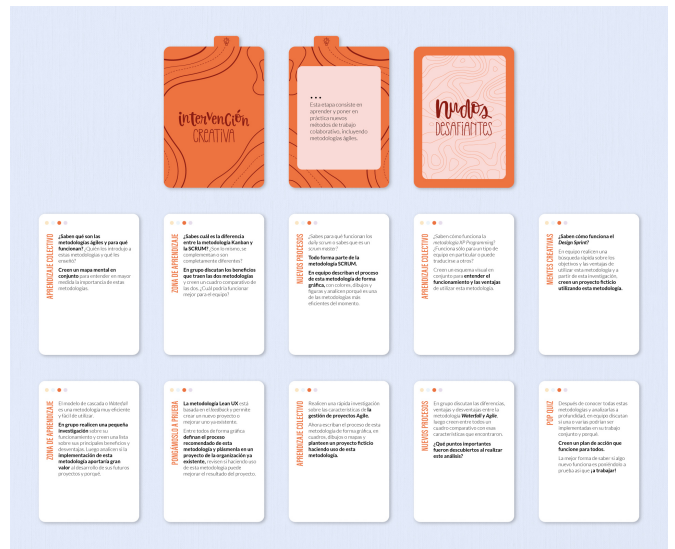
Figura 4. Cartas de la etapa Intervención Creativa.