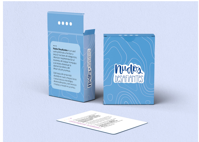
Figura 7. Empaque Nudos Desafiantes.

La caja tiene unas dimensiones de largo 62 mm, ancho 18 mm y alto 90.1 mm donde las cartas pueden ser almacenadas de forma cómoda en una sola pila y esta puede ser abierta por la parte de arriba para mayor control. El color del empaque es un azul menos brillante que el de una de las etapas internas y este va acompañado de otra textura tipo ondas de color casi blanco. En una de sus caras se puede observar el logotipo del producto y en la otra una breve descripción de la funcionalidad del mazo. En las caras laterales puede verse el logotipo en su versión horizontal. En la parte de adentro de la caja se puede observar el mismo color y la misma textura de afuera en toda la extensión del modelo. Para crear las líneas de troquelado de la caja utilicé una herramienta llamada Pacdora el cual tiene empaques para diferentes productos en formato mockup y troquelado que pueden ser modificados dependiendo de la necesidad, así que a partir de esa base pude realizar con medidas exactas el modelo de la caja en Illustrator.