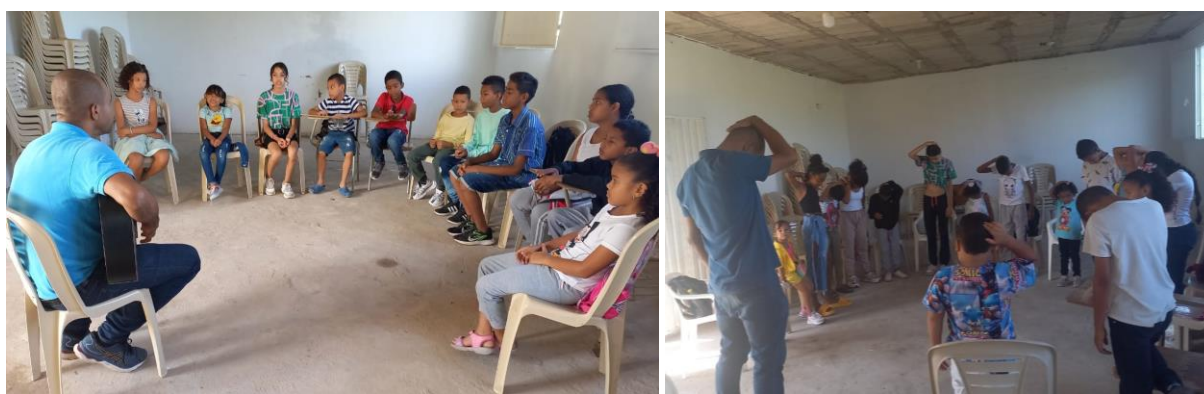
Fotografía 2 Ensayos del plan piloto

Hay que resaltar que en el proceso de formación musical se incorporó un repertorio tradicional de los ritmos Cumbia y Tambora, promoviendo en los niños y jóvenes el reconocimiento de su identidad cultural y de la riqueza musical del territorio colombiano, en especial de la región del caribe.