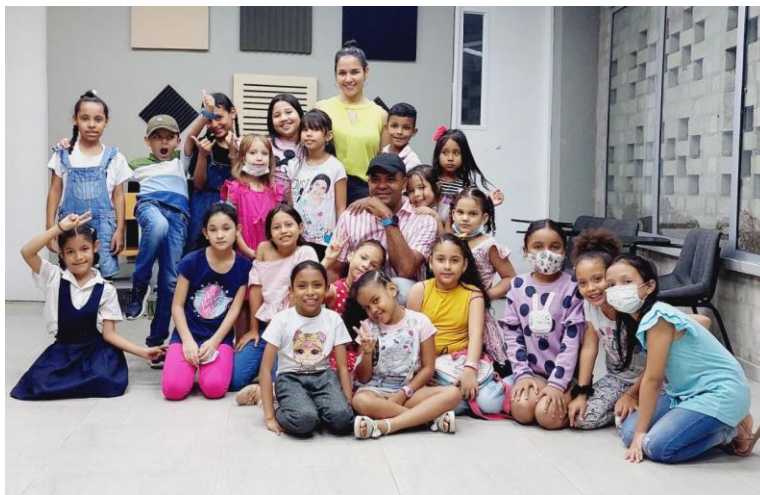
Fotografía 1 Convocatoria de niños para el coro

Para atraer a los jóvenes de la comunidad y sus padres, se realizaron convocatorias en instituciones educativas cercanas y en la misma Parroquia San Antonio María Claret. Estas convocatorias permitieron una comunicación constante con la comunidad para garantizar una participación activa.