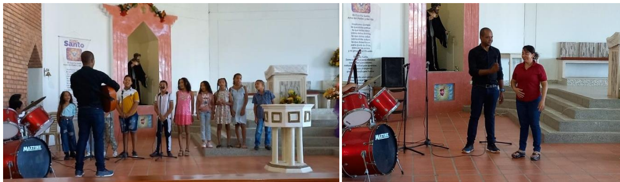
Fotografía 3 Presentación final del coro