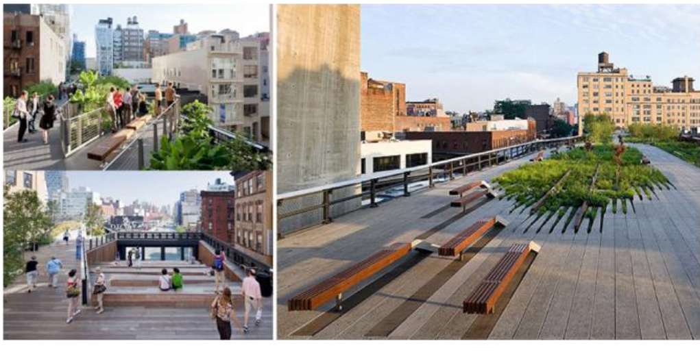
HIGH-LINE James Corner New York, NY, EE.UU

bases para la búsqueda de igualdad de oportunidades y la eliminación de la discriminación, por medio de la generación de los siete principios fundamentales que se encontraban orientados a su impacto en los grandes entornos a gran escala y la generación de productos bajo la idea de justicia social (Ospina, A & Rodriguez D. 2017: 110).