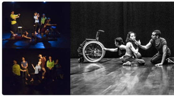
ConCuerpos Danza Contemporánea Integrada Bogotá D.C., Colombia

ConCuerpos aparece entonces, como un elemento y una entidad 18 reflexiva, resistente y crítica que podría permitir el análisis y el abordaje metodológico de la relación entre el Diseño Industrial y la Danza Contemporánea Inclusiva, que permite fundamentar dicho análisis, naciendo y tomando relevancia el concepto de extrema diversidad . La extrema diversidad se entiende entonces como ese espacio, lugar y momento en el cual se encuentran todos los tipos (categorías lógicas, académicas, prácticas, filosóficas, etcétera) y categorías de cuerpos (formas, constituciones y relaciones con el entorno), que permite que exista una verdadera integración e inclusión.