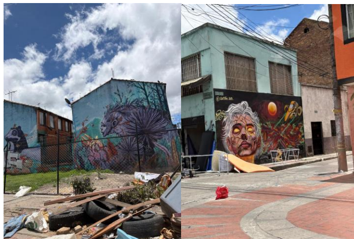
Ilustración 5 Figura 6 y 7. Documentación fotográfica de espacios deteriorados contrastados con graffitis de alto valor estético.

De los graffitis observados en el recorrido se destacan los de tipografías elaboradas, en algunos se resaltan personajes caricaturescos o retratos simbólicos, resaltando que los mismos son parte de la forma de expresión el barrio, de comunicación de sentimientos, siendo un lenguaje alternativo que comunica las realidades sociales que viven los habitantes del barrio, población con una condición económica de estrato 2, en donde la desigualdad, la pobreza y el abandono estatal, son el diario vivir.