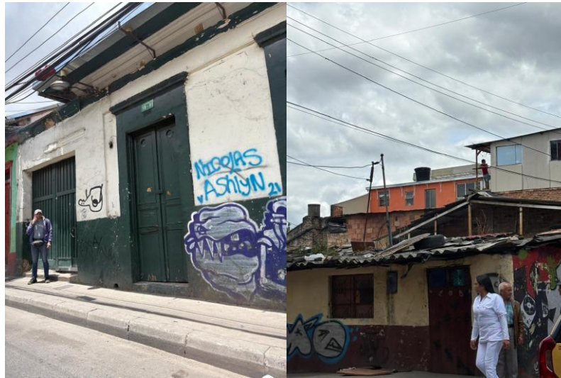
Ilustración 4 y 5. Documentación fotográfica de contrastes arquitectónicos y memoria urbana.

Dentro del recorrido realizado, se encontraron paredes que personifican el arte urbano y expresan la realidad de la comunidad, donde los artistas elaboran sus obras en un estado de completa autonomía y sin estándares.