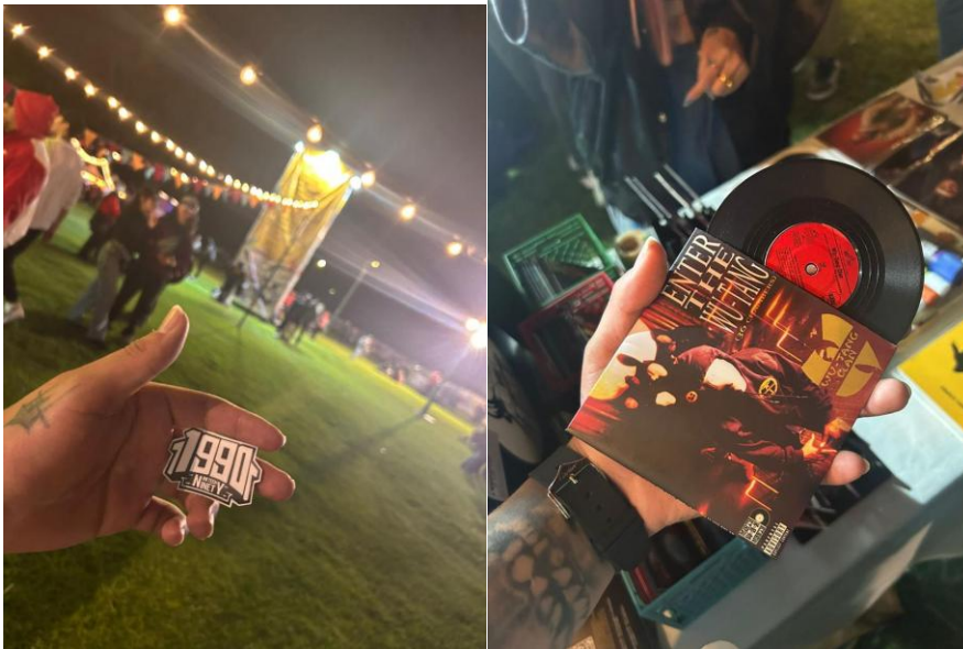
Ilustración 10 Figura 18 y 19. Documentación de mercancía promocional de tipo sticker y cds con estética de vinilos.