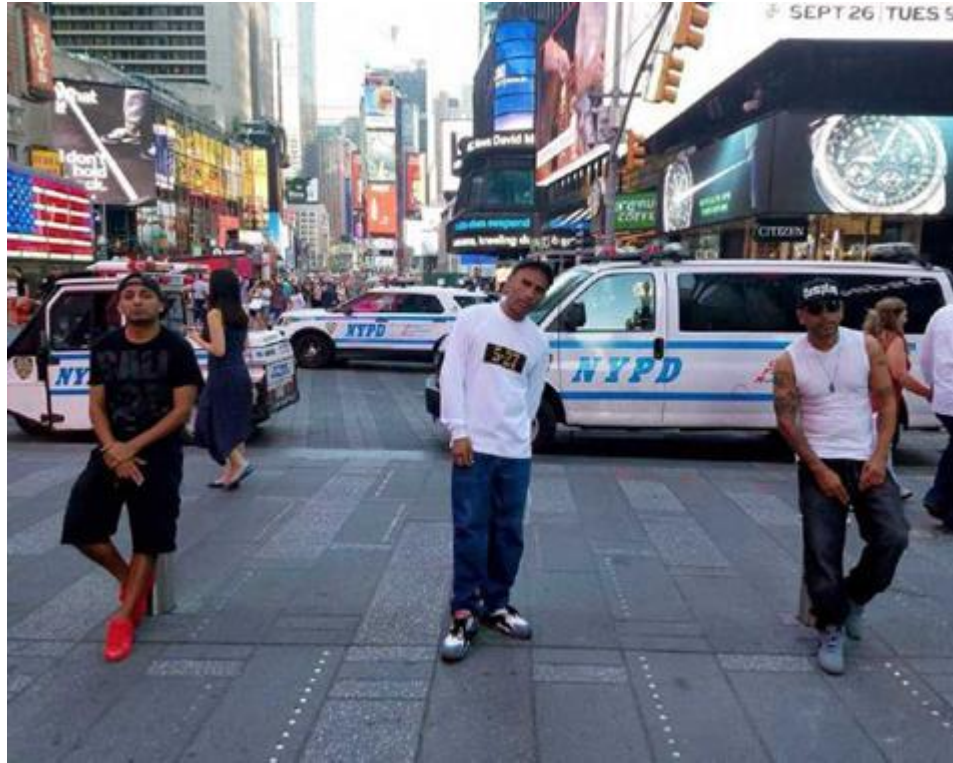
Ilustración 3. Imagen de la banda La Etnia en Times Square, Nueva York (Estados Unidos), 2017.