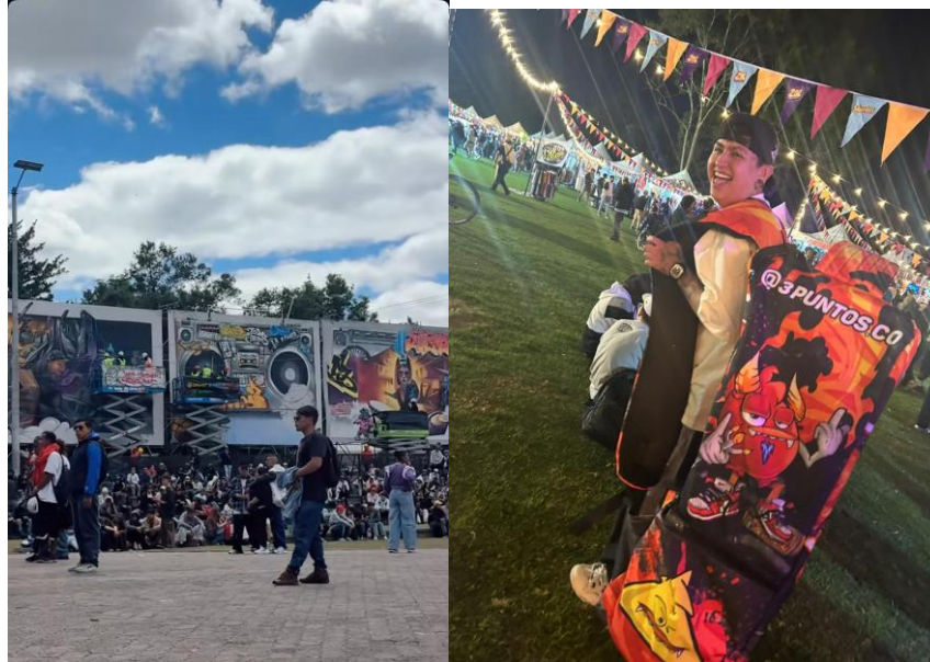
Ilustración 9 Figura 16 y 17. Estéticas halladas en la etnografía participativa realizada en “Rock al Parque”.

representativas de la cultura hip hop , donde podemos ver que el festival es más que un simple concierto.