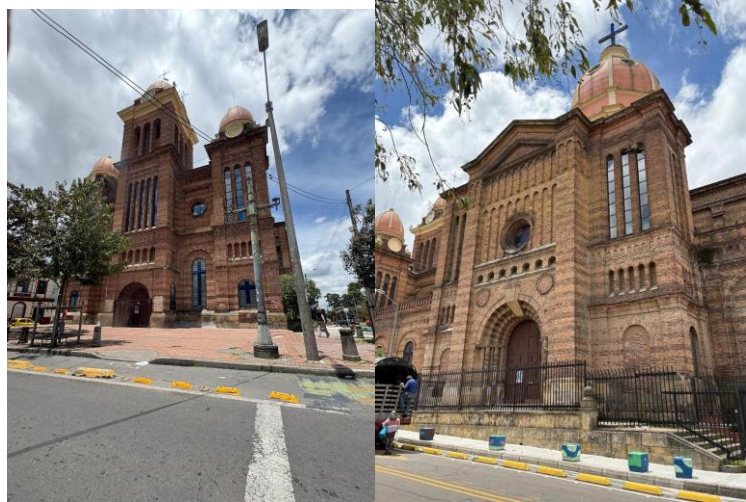
Ilustración 7 Figura 12 y 13. La imagen del templo imponente en el corazón del barrio con una situación socioeconómica precaria muestra otro nivel de identidad lo religioso y lo histórico que conviven con lo urbano y lo alternativo.