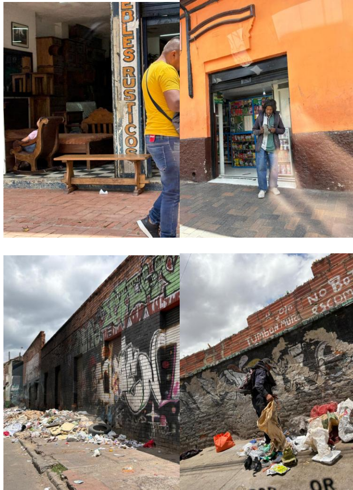
Ilustración 6 Figura 8, 9, 10 y 11. Documentación de ventas en tiendas de barrio, muebles rústicos y personas que transitan, evidencias de un tejido social activo, donde el espacio público es muy importante como lugar de encuentro, comercio y resistencia frente a la p

Fuente: Fotografía propia realizada durante el trabajo de campo.