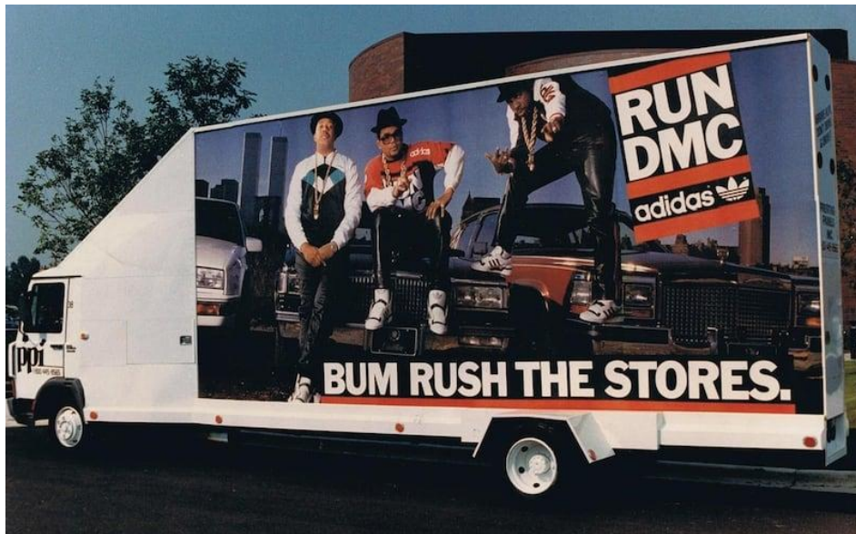
Ilustración 1. Valla publicitaria con imagen de la campaña realizada por Run DMC para la marca Adidas.