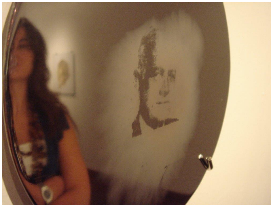
Aliento , Óscar Muñoz

Respecto a Aliento , baste con recordar que es una serie de discos de acero inoxidable, montados, en octubre de 1997, sobre la pared a la altura del espectador, tratados de tal manera (serigrafía de grasa, según Borja, en Museo de Arte del Banco de la República, 2011, pág. 88) que, cuando el espectador se acerca y sopla su aliento sobre el disco, se forma una imagen para luego desaparecer, una imagen de personas desconocidas, muertas y/o desaparecidas, fijadas en fotografías del pasado. Por ahora, mantengamos este acontecimiento de la imagen en nuestra memoria.