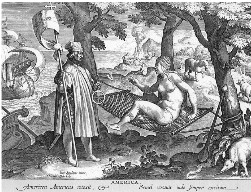
América, Theodor Galle a partir de Jan van der Straet, grabado en cobre (Tomada de Gaudio, 2008, pág. xv).

Hay también una segunda consideración acerca del dominio del concepto de “raza” y de su facticidad, como noción determinante en la configuración y comprensión del otro americano. La noción de “raza” comporta una tendencia etnocentrista de las imágenes y testimonios de los descubridores (acaso una tendencia aún superviviente hoy) que termina por identificar al aborígen americano con el “indio”. La diferenciación racial y la adopción del criterio de raza para construir la imagen del otro, actuará como criterio fisiológico, pero también como determinante política y social para justificar la estratificación económica, política y social: por ejemplo, al identificar al aborígen con una raza salvaje o muy cercana a un estado de naturaleza, se justificará su sometimiento y cristianización, para fines económicos e ideológicos 67 . El criterio racial estará en acción en los diferentes estadios de la configuración del otro, su imagen y su cuerpo: así, las primeras imágenes reportadas e inscritas por Colón y los primeros españoles, exhiben la fuerte influencia de mitos orientales