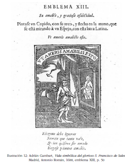
Ilustración 12: Adrián Gambart, Vida simbólica del glorioso S. Francisco de Sales , Madrid, Antonio Román, 1688, emblema XIII, p. 50