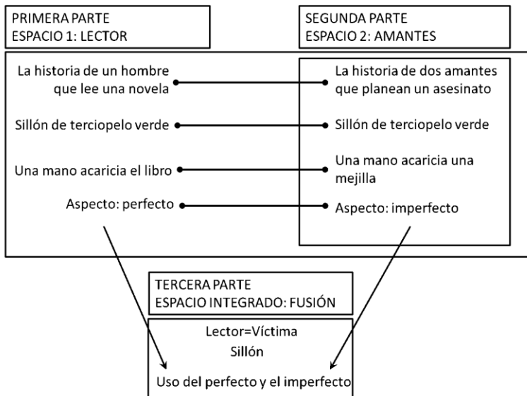
FIGURA 2. Espacios narrativos en Continuidad de los parques

En la figura 2 presento la estructura narrativa de la novela, identificando los mapeos y la integración. El espacio 2 aparece incluido dentro del espacio 1, pero en la interpretación final lo que hay es una fusión de los dos espacios en un espacio integrado.