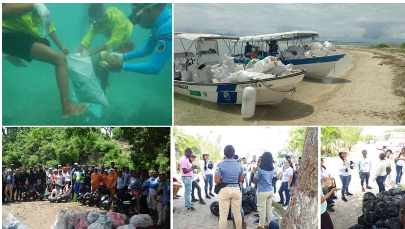
Figura 2. Implementación de jornada de limpieza de playa en el PNN Los Corales del Rosario y de San Bernardo. Limpieza subacuática (arriba), limpieza en tierra, sector Playa Blanca (abajo).

dentro del agua en direcciones opuestas. Posteriormente se subió el material extraído a la lancha, se categorizó en tierra para su conteo y pesaje. Finalmente, se recibió el refrigerio y se generó espacio para tomar registro fotográfico (Figura 2) de la actividad con todo el personal que apoyó la jornada” (Integrante del equipo PNNCRSB y participante de la jornada).