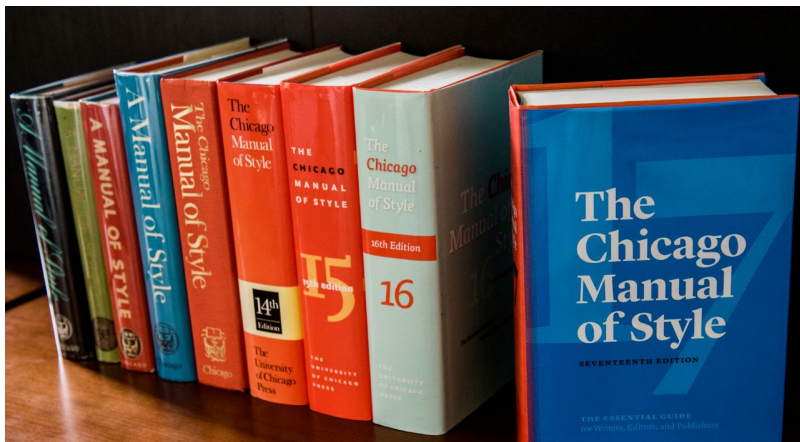
Cover Image of Editions 9-17 of the Chicago Manual of Style. Fotografía. 2017. Staff of the University of Chicago Press. http://www.chicagomanualofstyle.org/about16_facsimile.html