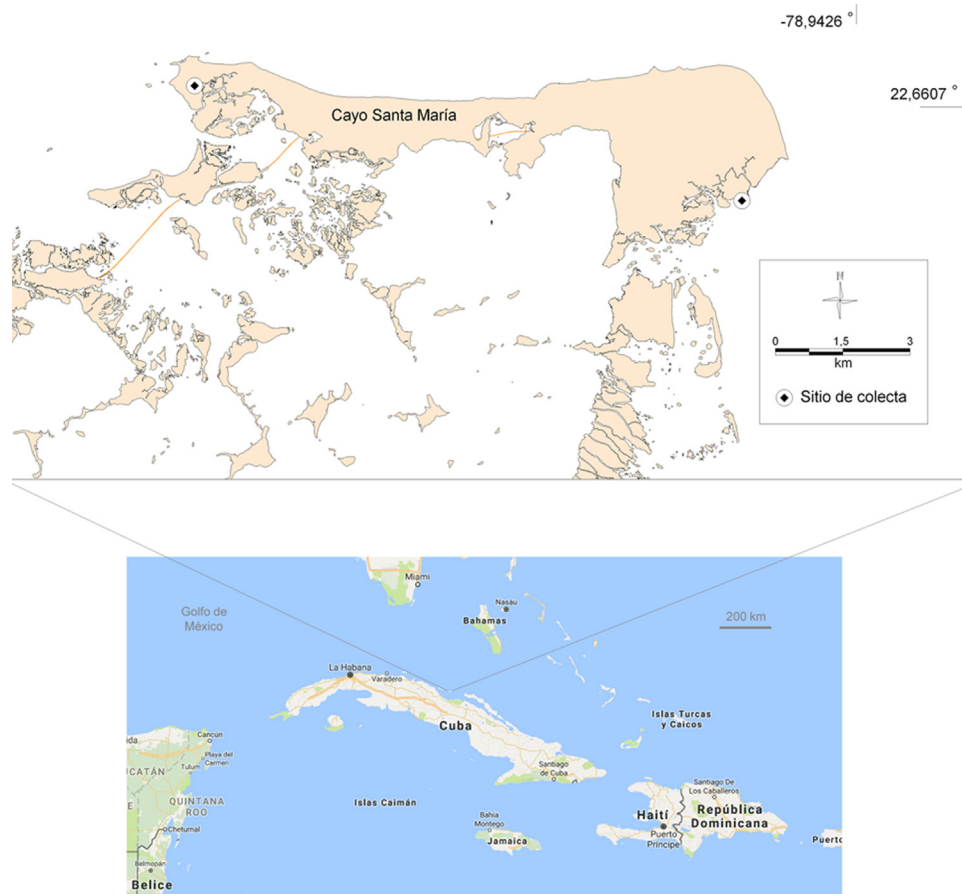
Figura 1. Ubicación del registro de Halophila ovalis en las Antillas Mayores.

dispersarse a grandes distancias, al considerar su bajo porcentaje de divergencia genómica. En esta nota se confirma su presencia por primera vez en aguas marinas cubanas, ampliando su rango de distribución en el Atlántico, a más de 1,800 km al noroeste del último reporte.