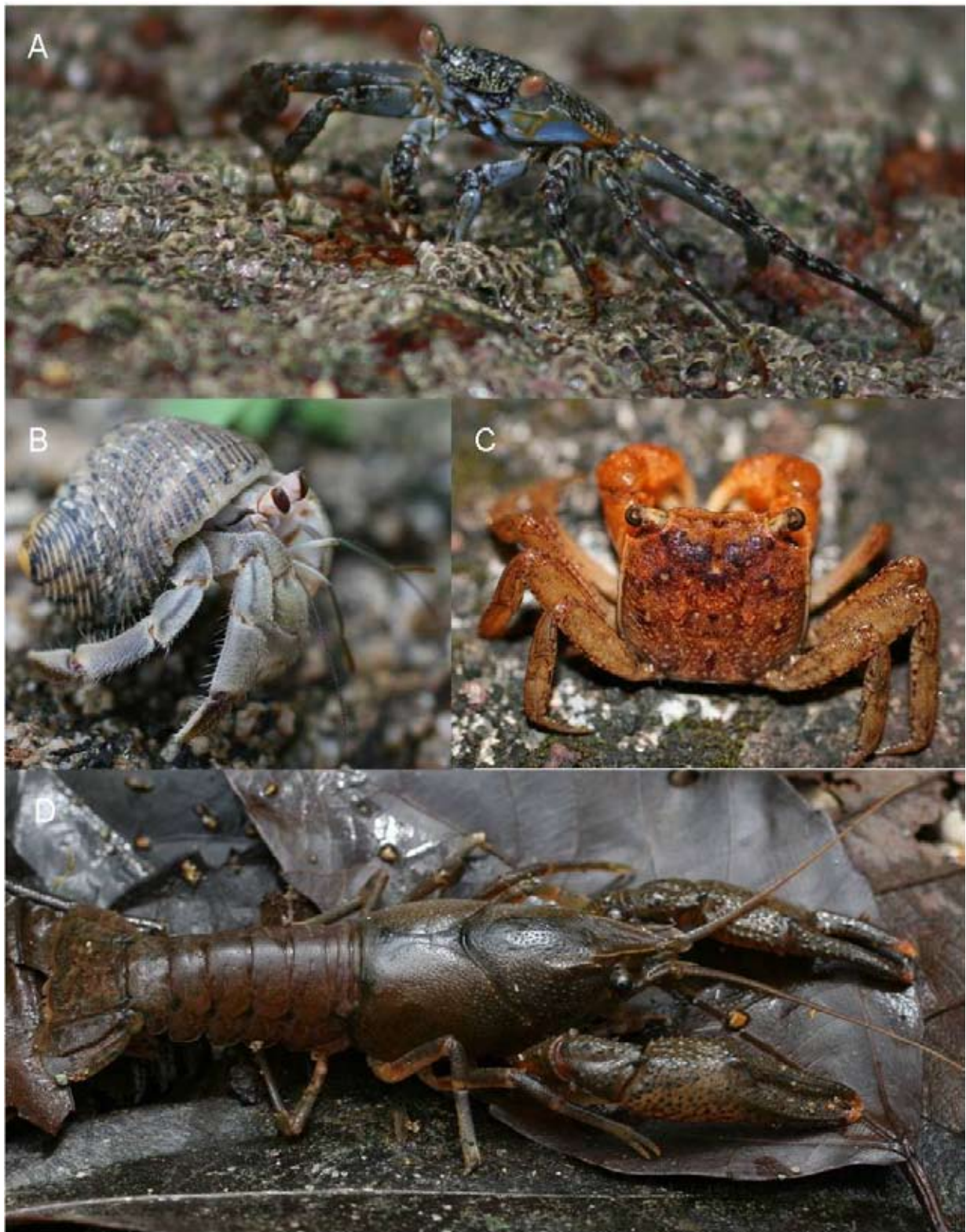
Figura 1. Formas representativas de los Decapoda: A, Grapsidae, Grapsus grapsus ; B, Coenobitidae, Coenobita compressus ; C, Sesarmidae, Armases americanum ; D, Cambaridae, Procambarus cuetzalanae .