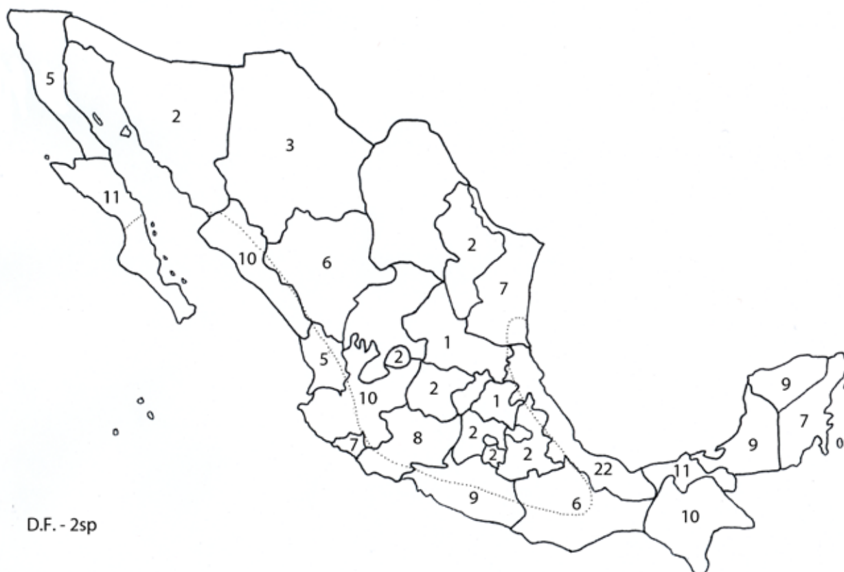
Figura 3. Riqueza específica del phylum Acanthocephala en vertebrados silvestres por estado de la República Mexicana.

las (6) y salobres (5). Sólo los muestreos sistemáticos en hospederos y regiones poco o nada estudiadas permitirán conocer este aspecto con precisión.