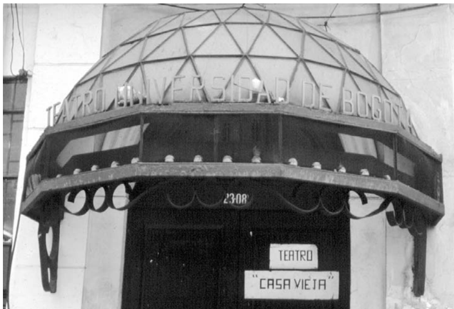
Casa Vieja se convirtió en emblema del Grupo de Teatro de la UJTL. Actualmente en la casa se realizan diferentes actividades culturales.

Uno de los temas de reflexión para aproximarse a la comprensión actual del bienestar universitario es el desarrollo humano , el cual ofrece desde el Área respectiva sesiones de yoga, tai-chi y danzas circulares que posibilitan el crecimiento personal a partir de la promoción de valores que fortalecen la autoestima y el reconocimiento del ser interior.