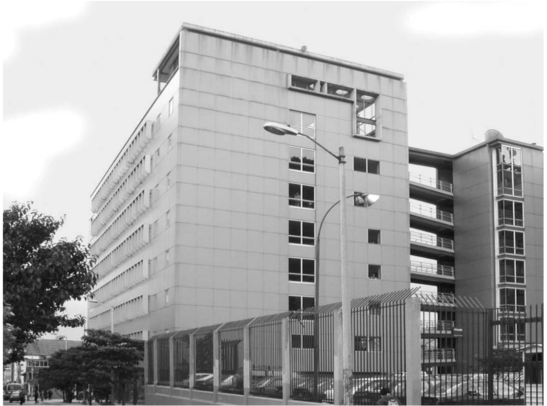
Sede de Bienestar Universitario.