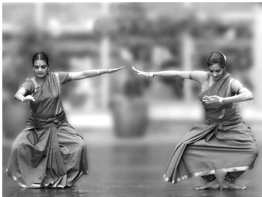
Presentación de danza de la India en la UJTL en 2003.

Música en Secuencia es otro programa que ofrece, en diversos espacios de la Universidad, tres franjas de conciertos: los formales, dirigidos a invitados especiales de carácter profesional. Hacia octubre del año 2000, por ejemplo, recién creado el Centro de Arte y Cultura, la Universidad tuvo la oportunidad de disfrutar del concierto Fantasía Caribe , con la participación de la Banda Sinfónica Nacional de Colombia, bajo la dirección del maestro Francisco Zumaqué, quien lanzó este trabajo auspiciado por el Ministerio de Educación Nacional. Este concierto se realizó en homenaje a los 60 años de labor cultural ininterrumpida de la Radiodifusora Nacional. El evento fue transmitido en directo por Señal Colombia y en diferido por la HJUT 106.9, de la Tadeo. Recitales de ópera, piano y guitarra clásica también han hecho parte de esta programación y han demostrado que existen grupos de las nuevas generaciones de estudiantes receptivos a estas manifestaciones artísticas.