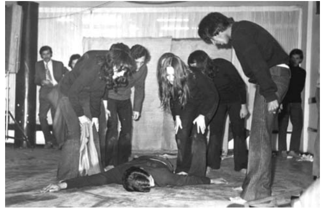
Teatro en los años 80 y danza en el 2002

Puede hablarse, por otra parte, sobre el Área Artes Visuales, en la cual se desarrolla una oferta cultural permanente, por ejemplo, con la proyección de películas en diferentes formatos de acuerdo con ciclos temáticos . Programa, igualmente, franjas con propuestas de estudiantes y como apoyo a las cátedras de las facultades. Ofrece, asimismo, contextos académicos con el objetivo de hacer una aproximación a la historia e interpretación de la imagen en movimiento, con un enfoque humanista e interdisciplinario. El área ha buscado, por otra parte, hacer presencia en eventos de interés para la ciudad, como el Festival de Cine de Bogotá y la Muestra Internacional de Documental. Con el propósito de difundir la producción cinematográfica nacional, realizó proyecciones como "Fragmentos", de Carlos Santa, "La gente de la Universal", de Felipe Aljure, y "Soplo de Vida", de Luis Ospina, entre otras, todas ellas, acompañadas de charlas sobre la industria cinematográfica y la importancia de las jóvenes tendencias en la realización de películas colombianas, con apoyo de Patrimonio Fílmico y la Dirección de Cinematografía del Ministerio de Cultura.