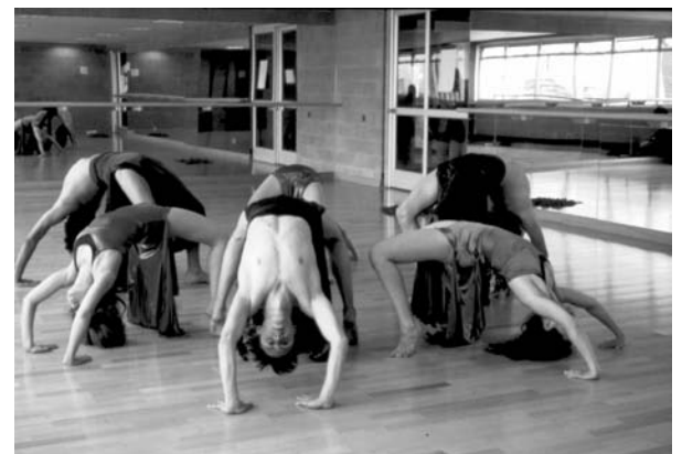
Grupo de danza contemporánea.