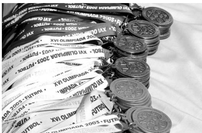
LA OLIMPIADA TADEÍSTA: 34 AÑOS DE HISTORIA

Durante casi todos estos cincuenta años de la Universidad, ha existido una actividad que involucra a toda la comunidad y ha dejado gratos y maravillosos recuerdos a todos aquellos que la han vivido, gozado, y sufrido; esta actividad es la Olimpiada Tadeísta, que durante 34 años ha venido siendo un punto de encuentro entre las facultades,